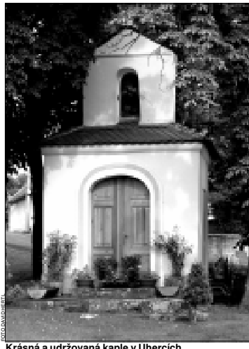
Krásná a udržovaná kaple v Uhercích.